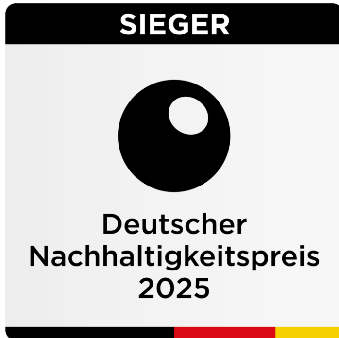
Siegel Deutscher Nachhaltigkeitspreis 2025