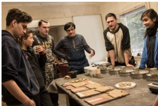
Forsthaus Lehmbauworkshop 2018

Beispielsweise wurden innerhalb eines Lehmbauworkshops die Innenwände eines Raumes des Forstschreiberhauses mit Lehm verputzt. Weiterhin wurden Treppen zum Dachboden und Keller für das Haus aus Holz gebaut. Der erfolgreiche Abschluss des Projektes erfolgte im Oktober 2019. In der Abschlussveranstaltung stellten die Teilnehmenden ihre Arbeiten am Forstschreiberhaus den Projektförderern vor.