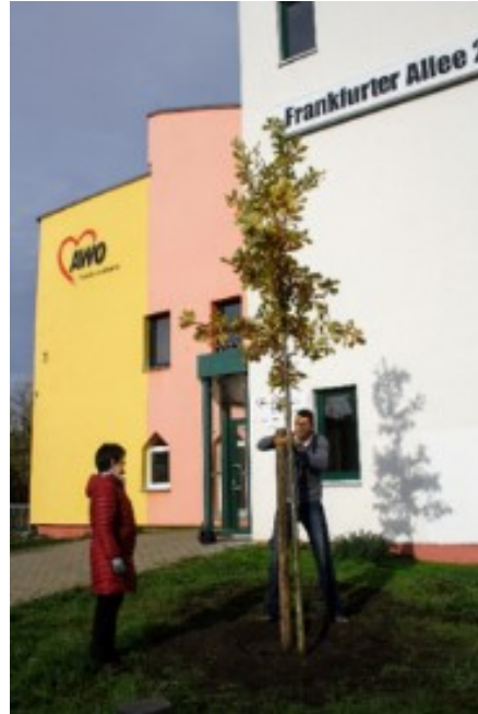
Pflanzung der Eiche am Haupteingang des AWO-Gebäudes