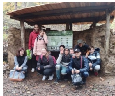
2022 Dacherneuerung der Informationstafel an der Schwärze