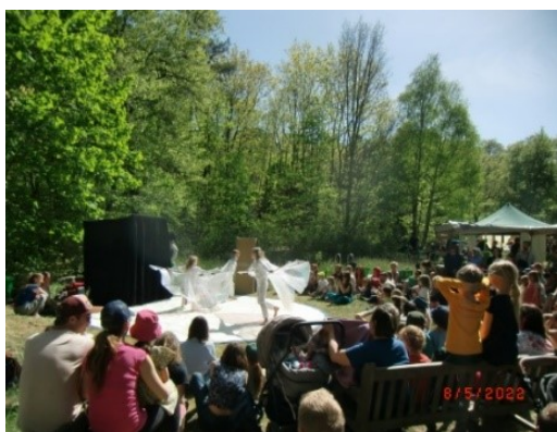
Tag der Sortenvielfalt 2022

Im Jahr 2022 führte die Zirkusgruppe eine Zirkusshow zum Tag der Sortenvielfalt mit Clownerie, Akrobatik, Feuerartistik und Zauberei auf. Im Mai wurde eine Zirkus -Theater Inszenierung auf der großen Infoveranstaltung von Lindhorst mit einem politischen Statement gegen Abholzung eines Waldstückes aufgeführt. Und zum Abschluss des Jahres erfolgte wieder eine Mitgestaltung der WaldWeihnachtsperformance „Reise in die Vergangenheit“ zur wieder in ursprünglicher Form veranstalteten WaldWeihnacht.