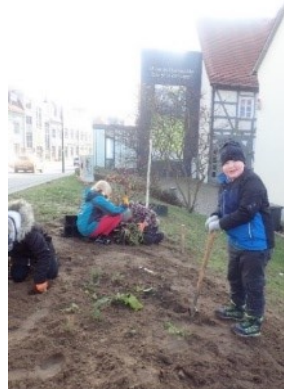
Pflanzaktion mit SchülerInnen