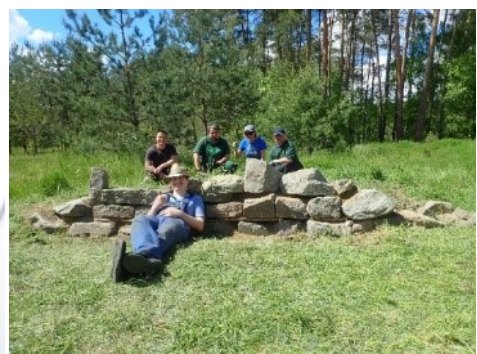
Errichtung einer Trockensteinmauer mit den Erwachsenen auf der Fläche der WHG