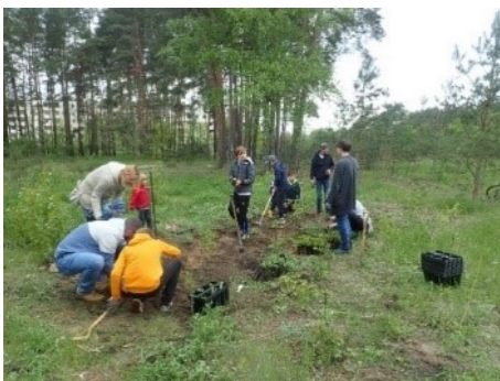
Pflanzaktion mit Eltern der SchülerInnen der Grundschule Schwärzesee