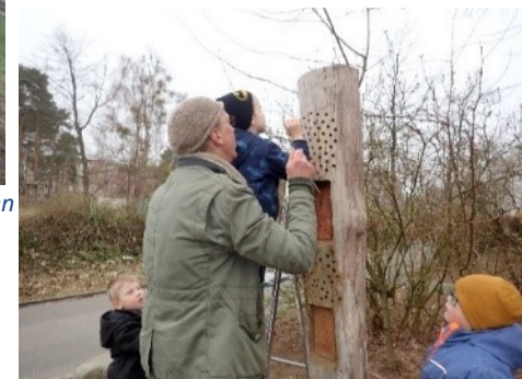
Aufstellung einer Insektennisthilfe mit Kindern der Kita Arche Noah