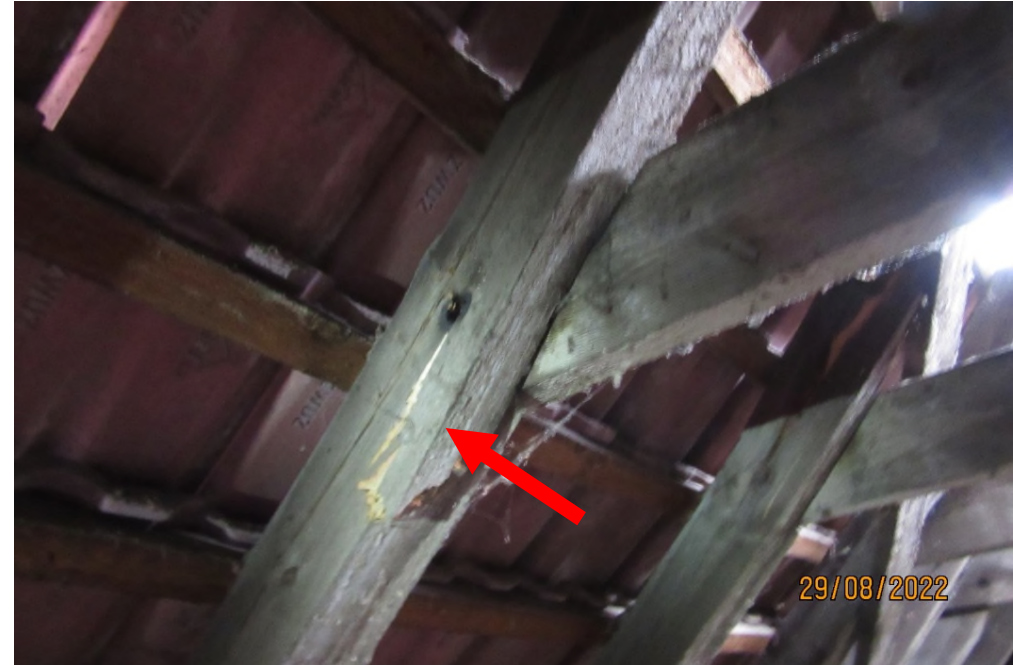
Bruch der Sparren im Bereich der Kehlbalken