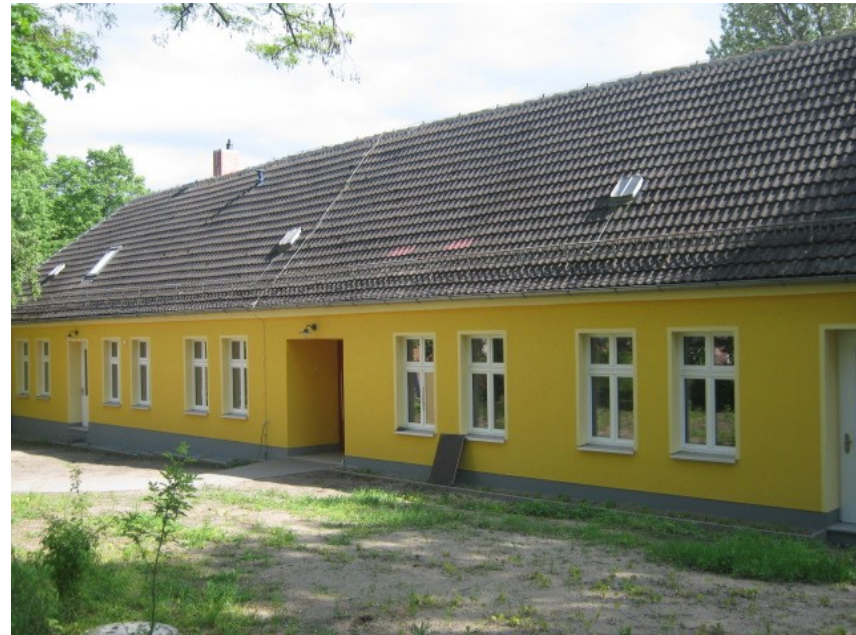
Haus 2 – Kindergarten und Hort