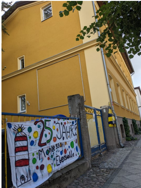
Haus 1- Grundschule und Hort