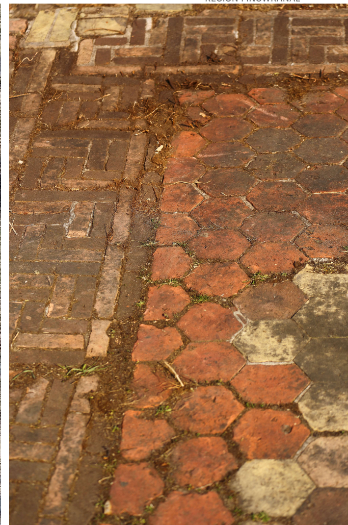
Schleuse Leesenbrück (Bodendenkmal) Foto Detail der Pflasterung, 2022