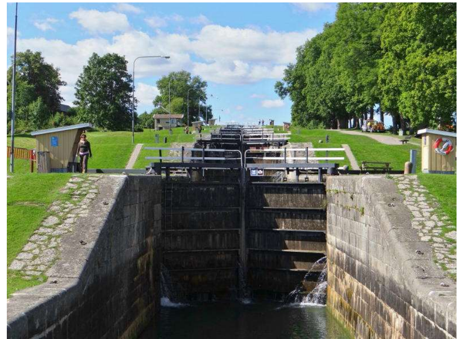
Göta Kanal bei Linköping, Schweden