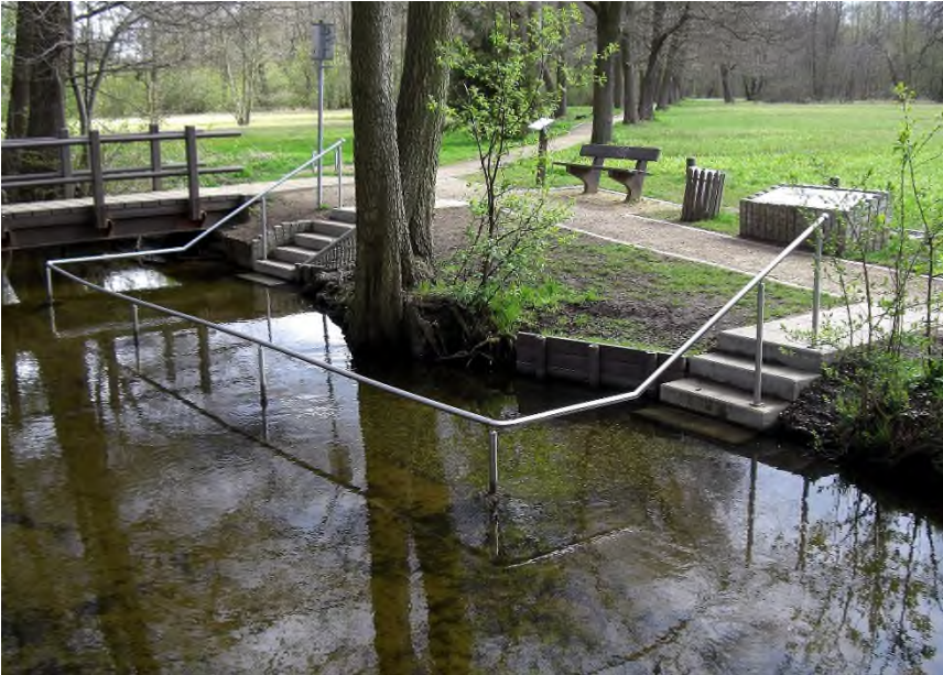
Kneipp-Anlage in der Briesse Gemeinde Birkenwerder, LK Oberhavel, BB