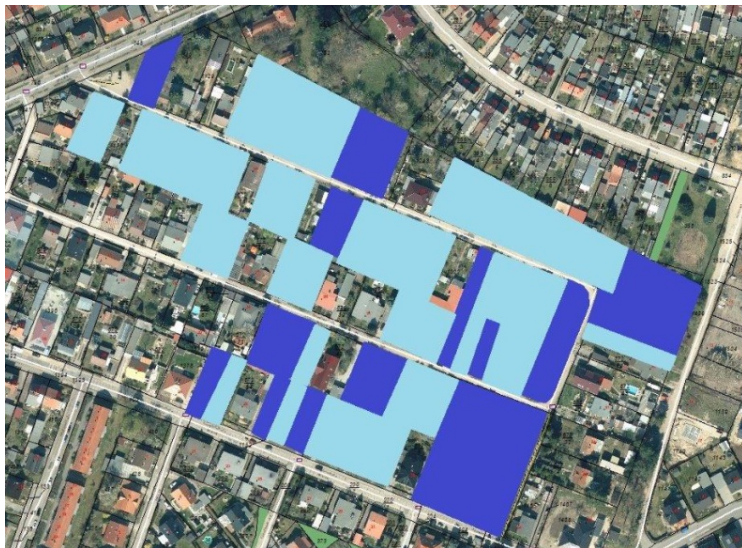
Abb.: Stand 20.10.2021

Lage: Stadtgebiet Ostend Eigentum: Grundstücksfläche im Eigentum der Stadt Eberswalde