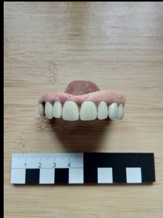
Befund 30 - Zahnprothese