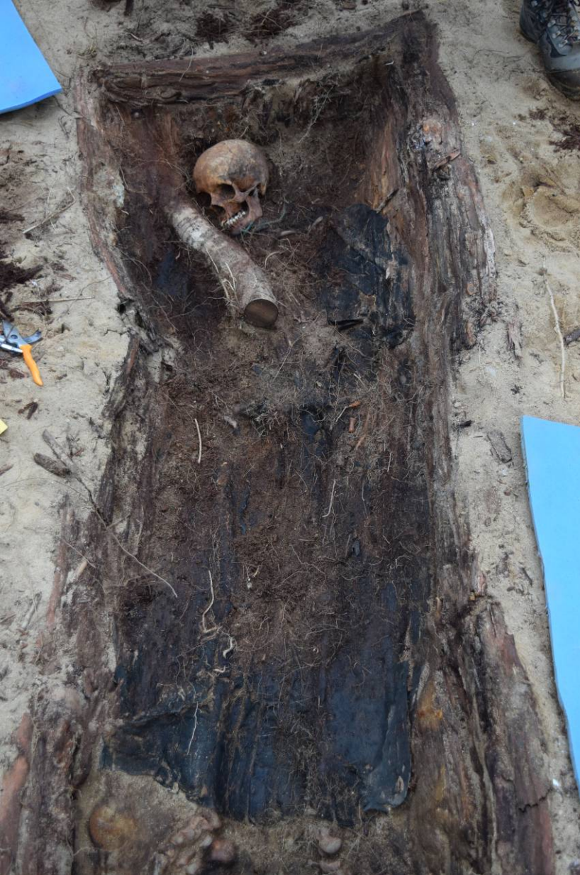
Befund 8 - Textilerhaltung