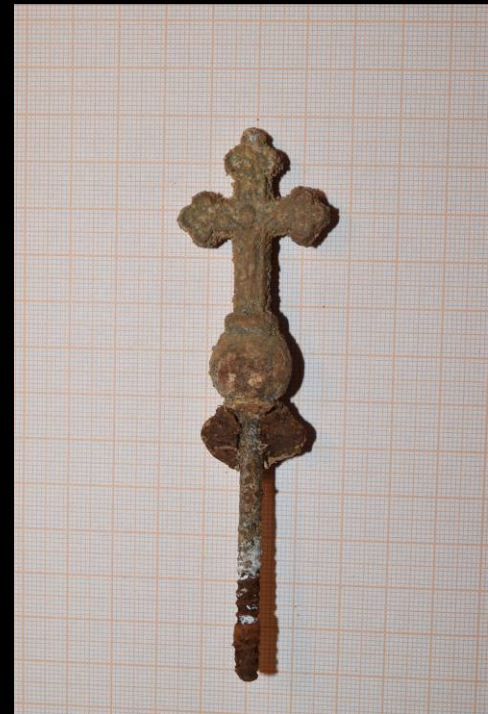
Befund 26 – Sargschraube