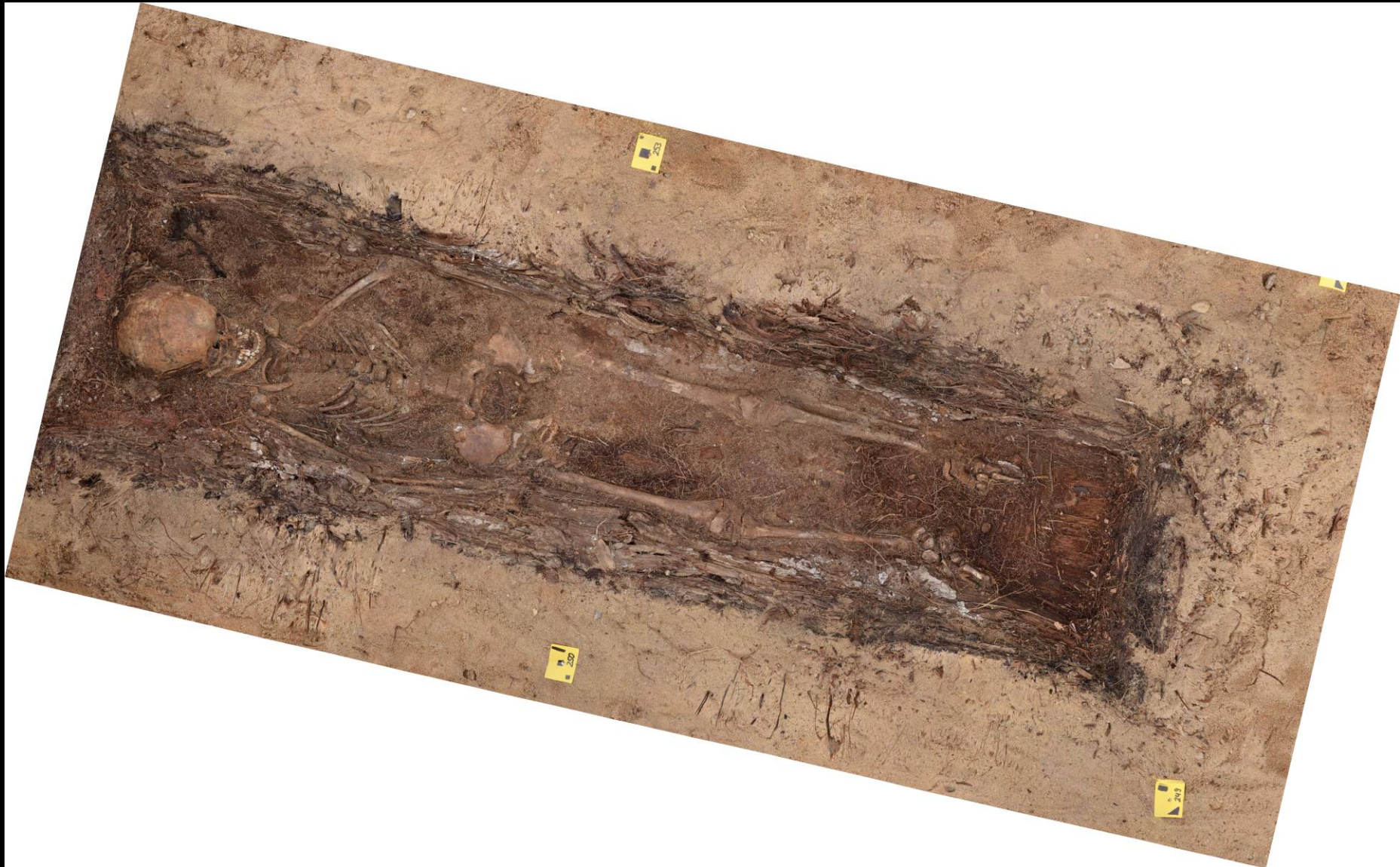
Befund 15 – junges Mädchen - Haarerhaltung