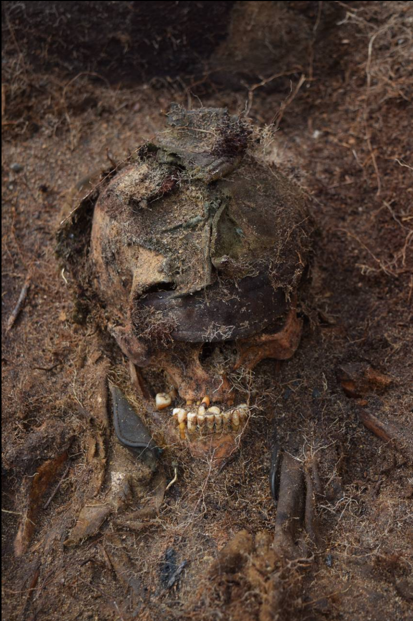
Befund 43 – mögliche Uniform