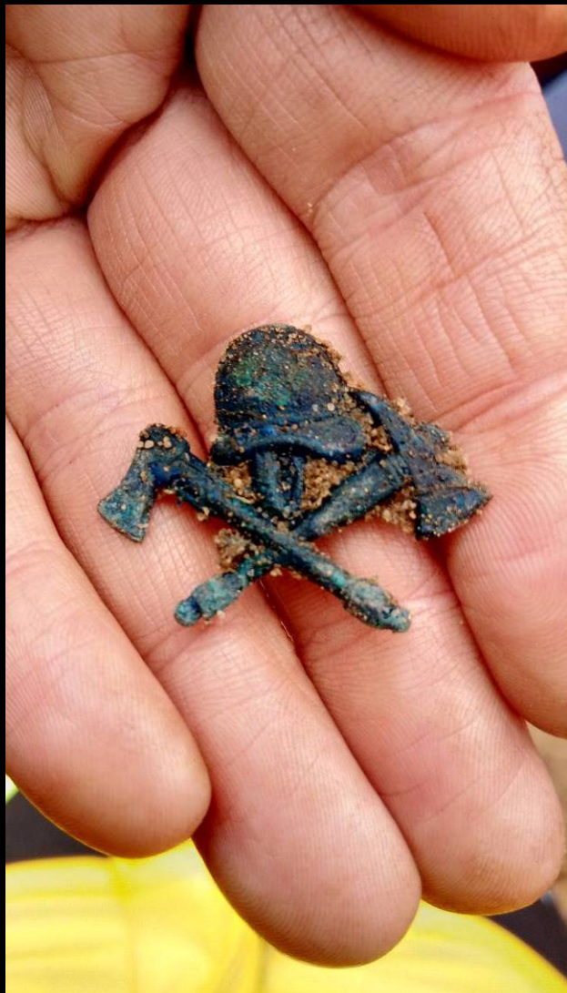
Befund 65 - Feuerwehrrabzeichen