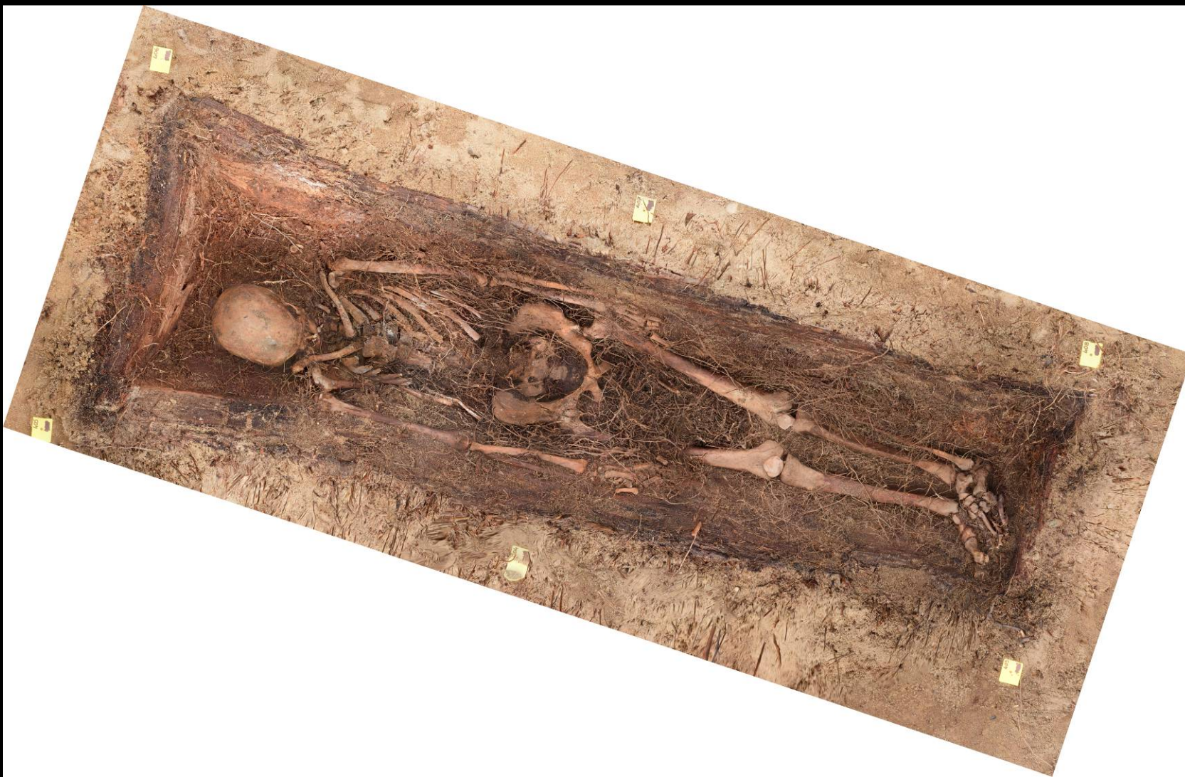
Befund 61 – Erschwerung der Arbeiten durch Wurzeln