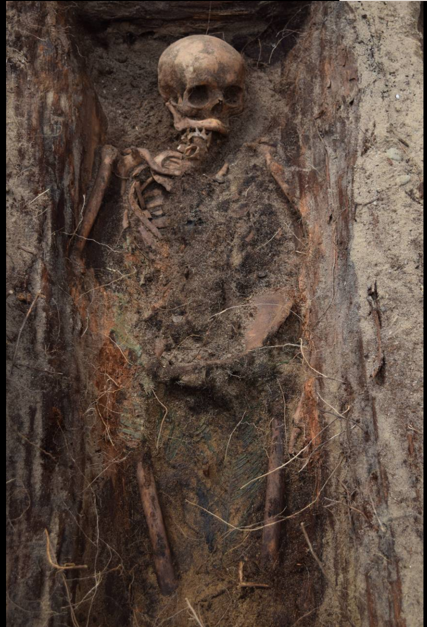
Befund 45 – Mitglied Kriegerbund