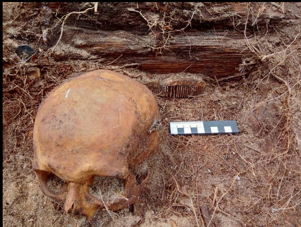
Befund 14 – Kamm (Totenwäsche)