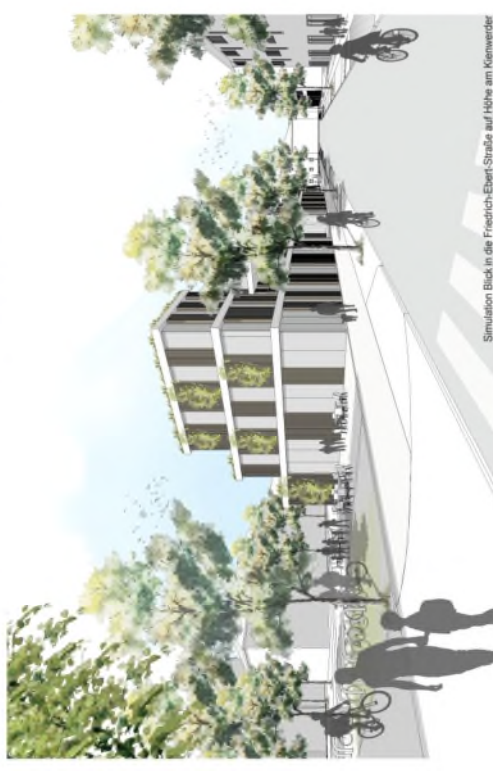
Simulation Blick in die Friedrich-Ebert-Straße auf Höhe am Kienwender