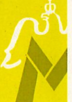
Märkischer Stadt- und Landbote, 1936. Abb.: Kreisarchiv Barnim

© Kulturland Brandenburg 2010 Mut & Anmut Frauen in Brandenburg - Preußen