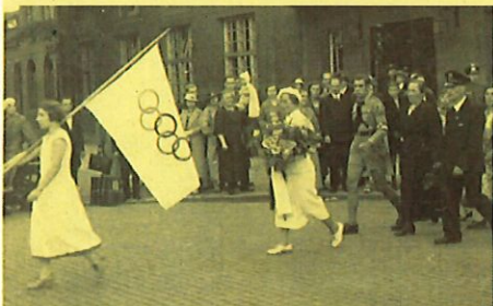
Empfang Erna Bürgers nach ihrem Olympiasieg auf dem Eberswalder Bahnhof, 1936.