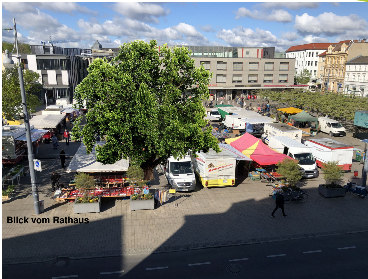
Blick vom Rathaus