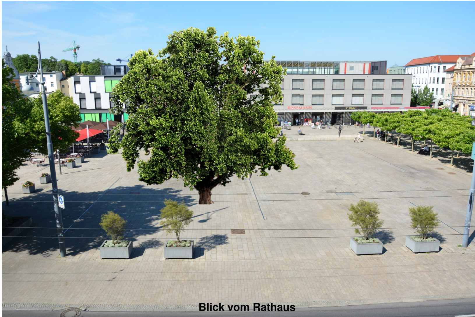
Blick vom Rathaus