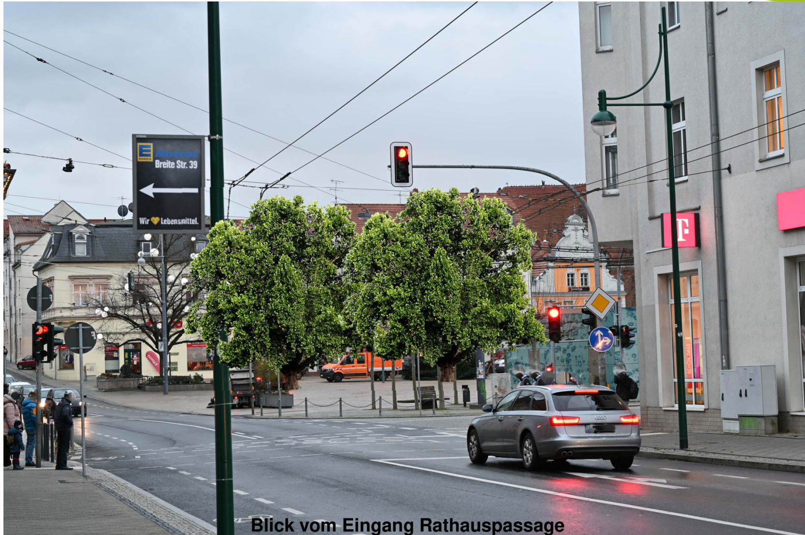
Blick vom Eingang Rathauspassage