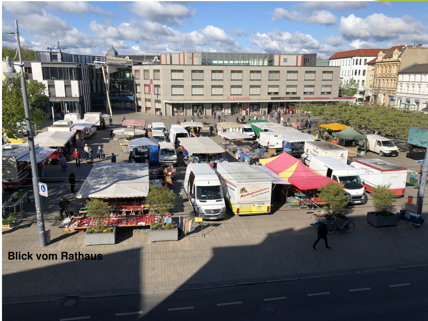
Blick vom Rathaus