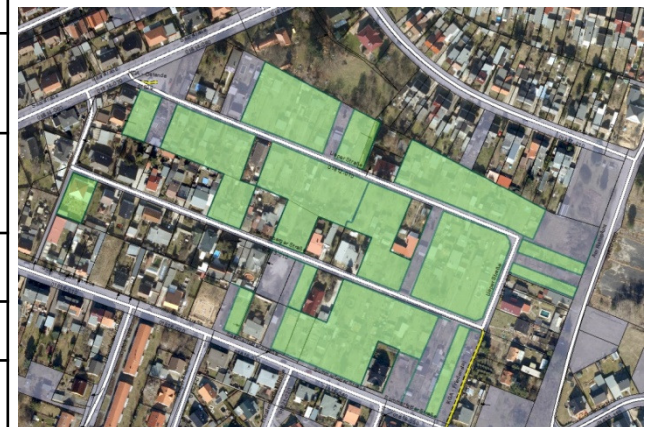
40 Baugrundstücke für Eigenheime

Abbildung: Grün Kleingartenparzellen, die von den Pächtern noch nicht aufgegeben wurden Blau Kleingartenparzellen, die von den Pächtern bereits an die Stadt zurückgegeben wurden