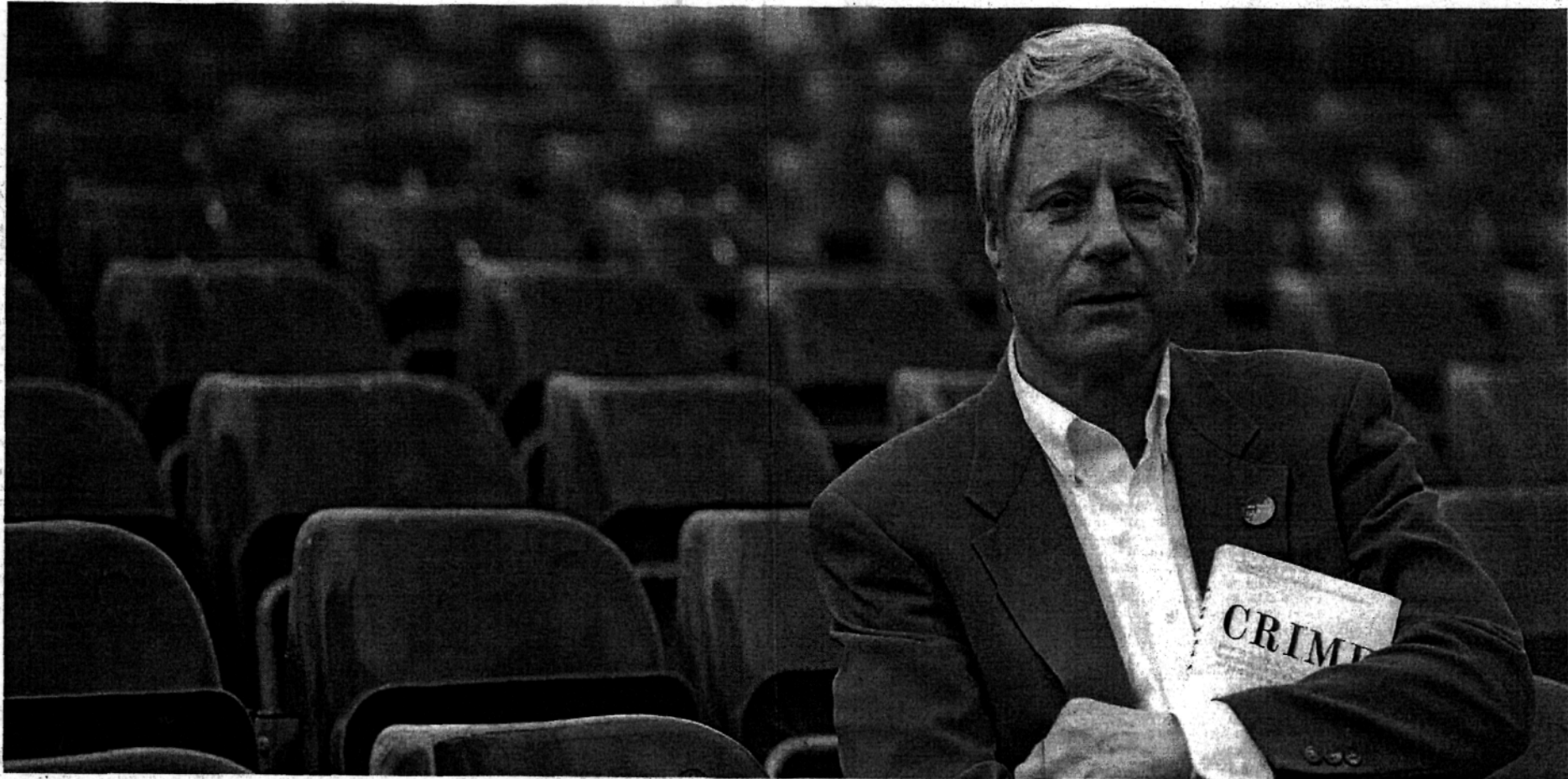
In Großbritannien kennt fast jeder Nick Ross, er hat unter anderem „Crime Watch“ moderiert, das „Aktenzeichen XY“ nachempfunden ist. Er ist aber auch Dokumentarfilmer, Psychologe und Kriminologist.