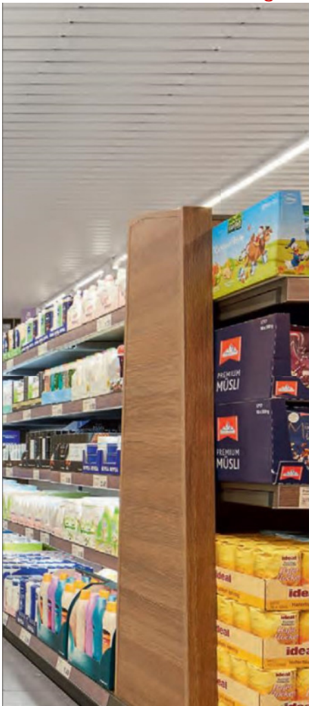
ALDI Eberswalde, Bergerstraße 113

Jeden Tag besonders – das neue ALDI Filial-Konzept.