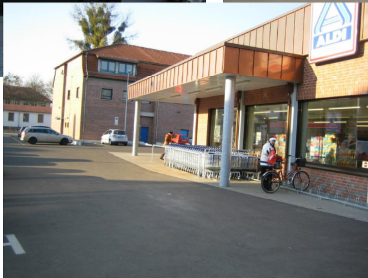
ALDI Eberswalde, Bergerstraße 113