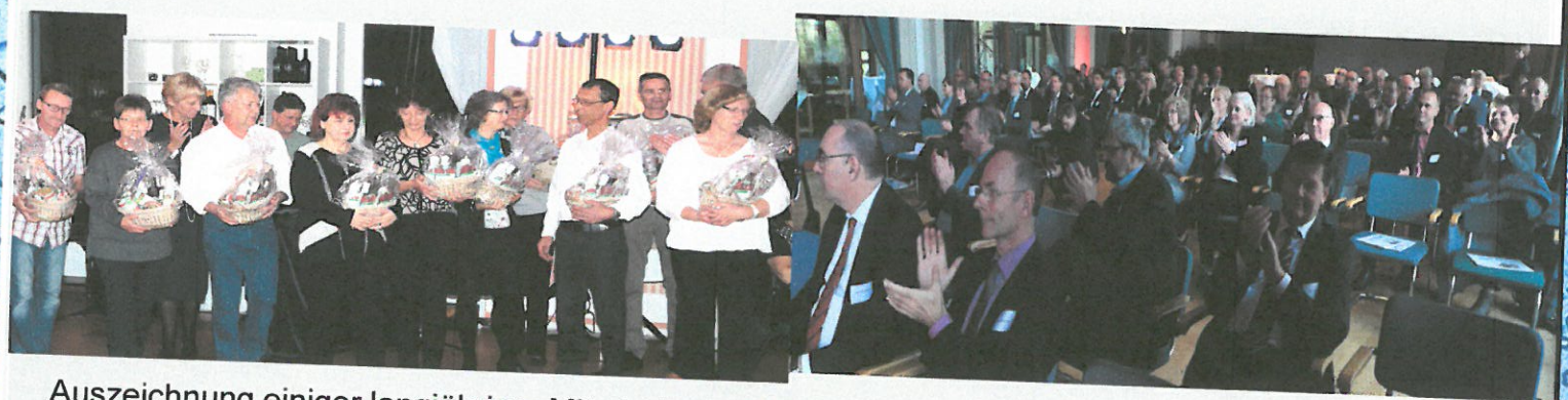
Auszeichnung einiger langjähriger Mitarbeiter im Rahmen der Betriebsfeier

Das Jubiläum wurde am 24.11.17 mit einer Festveranstaltung im Ringhotel Schorfheide gewürdigt und eine Betriebsfeier für die Mitarbeiter veranstaltet