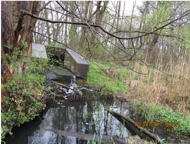
Einzugsgebiet 12 („Feuerwache“)