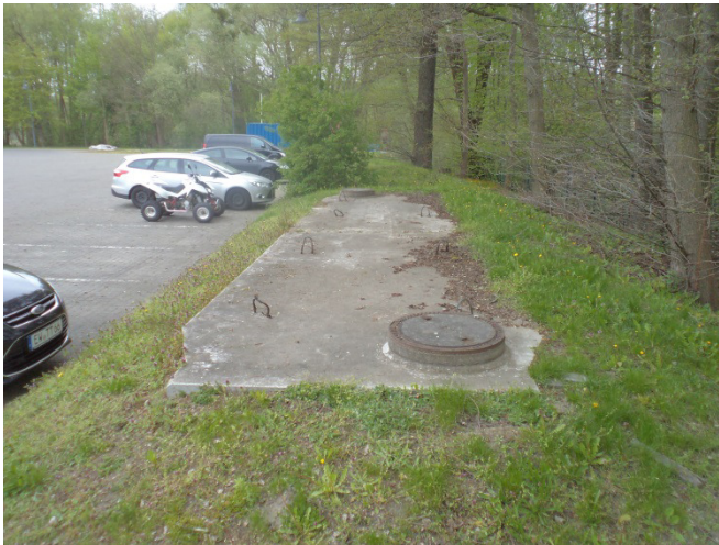
Einzugsgebiet 12 (Feuerwache)