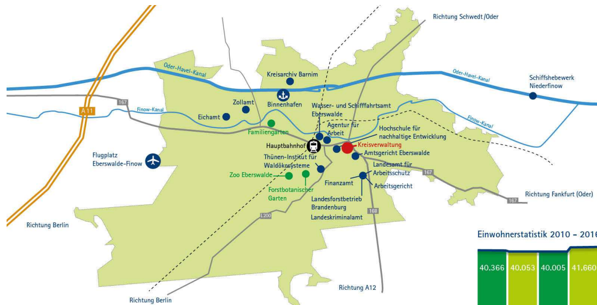
Einwohnerstatistik 2010 - 2016