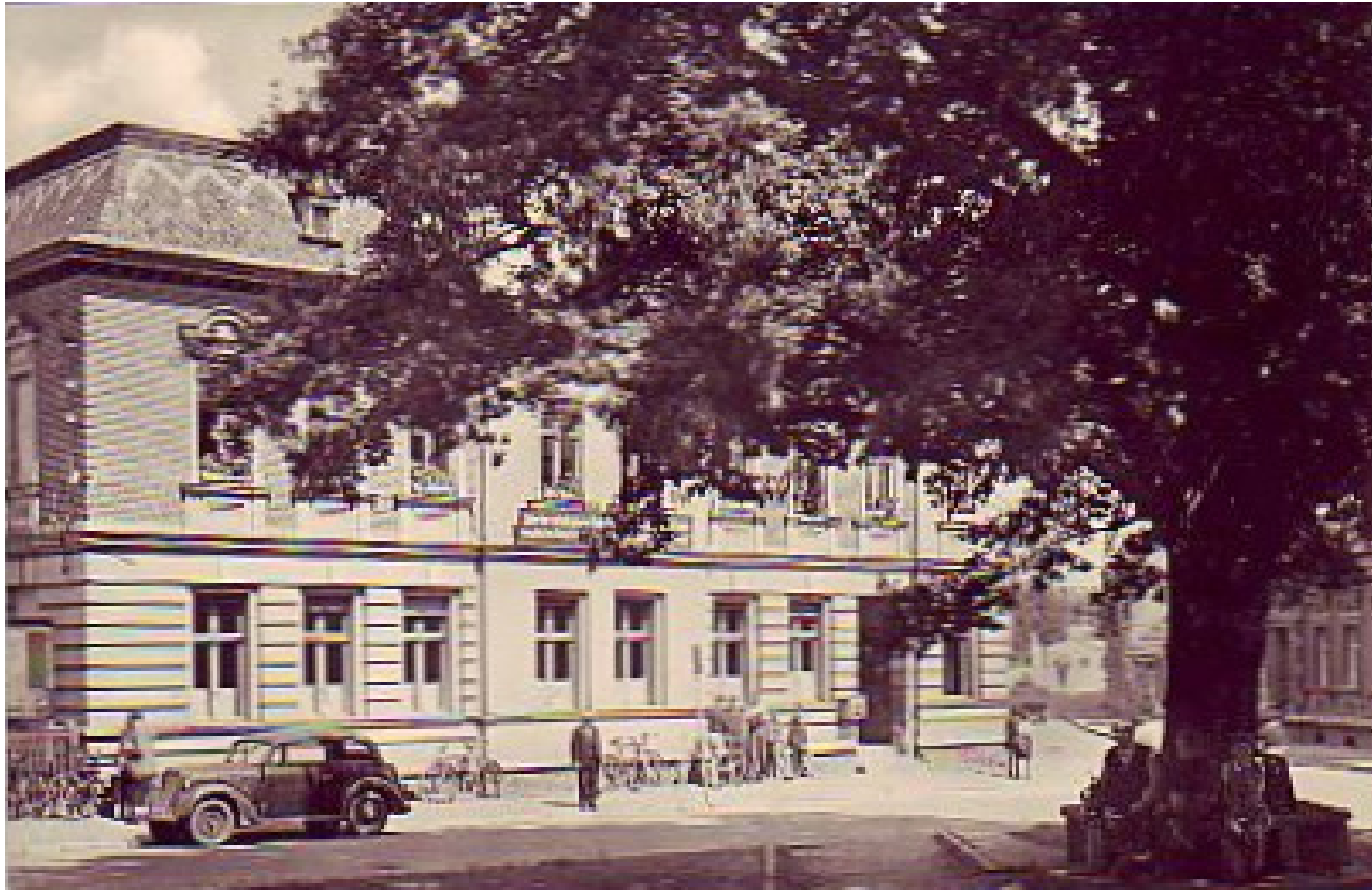
Historische Aufnahme (datiert: ca. 1961)