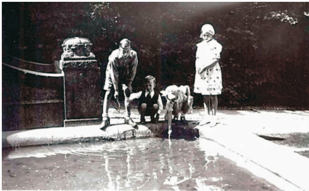
historische Aufnahme Brunnenbecken