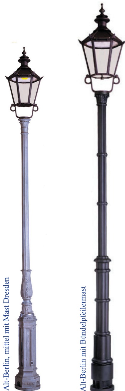
Alt-Berlin, mittel mit Mast Dresden

Eine Inspektionsklappe und ein klappbares Dach ermöglichen einen werkzeuglosen Zugang zu den Komponenten.