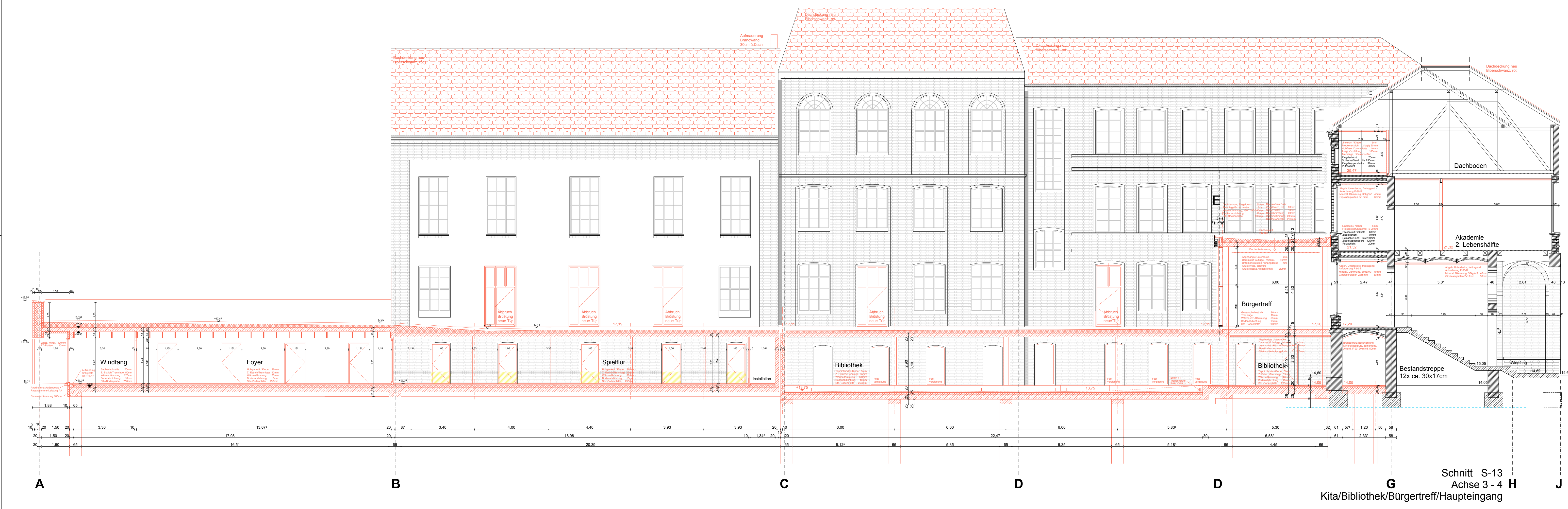
Schnitt S-13 Achse 3 - 4 H Kita/Bibliothek/Bürgertreff/Haupteingang